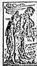
Marcas de Fábrica.

Esta medicina reúne además las virtudes de los hipofosfites de cal y de sosa que son grandísimos para el cerebro, los nervios y sistema físico. De ahí que fortalezca á los débiles. No hay sustancia que contenga en tan alto grado las propiedades nutritivas y reconstituyentes del aceite de hígado de bacalao. La forma más conveniente de tomarlo es la de “Emulsión de Scott.” Agradable al paladar. Reconocida universalmente por los médicos como la medicina-alimento por excelencia para los niños.