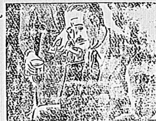
...cuando llegué a casa estaba nervioso y con un dolor de cabeza insuportable.