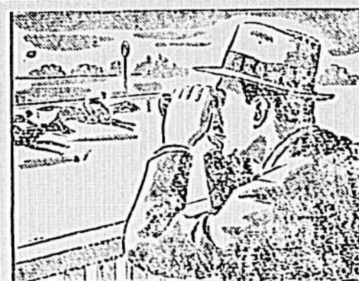
Esa tarde juzgaba más fuerte que de costumbre y la suerte no me acompañó...

Se vende una fracción de campo ubicada en la 3.ª sección, tierras especiales, para labranza, compuesta de 90 hectáreas más o menos, con montes naturales y a medio kilómetro de la estación Talita. Por intermedio ocurrir a la imprenta de LA VOZ DE FLORIDA y para tratar con su propietaria calle Constituyente 1848.—Montevideo.