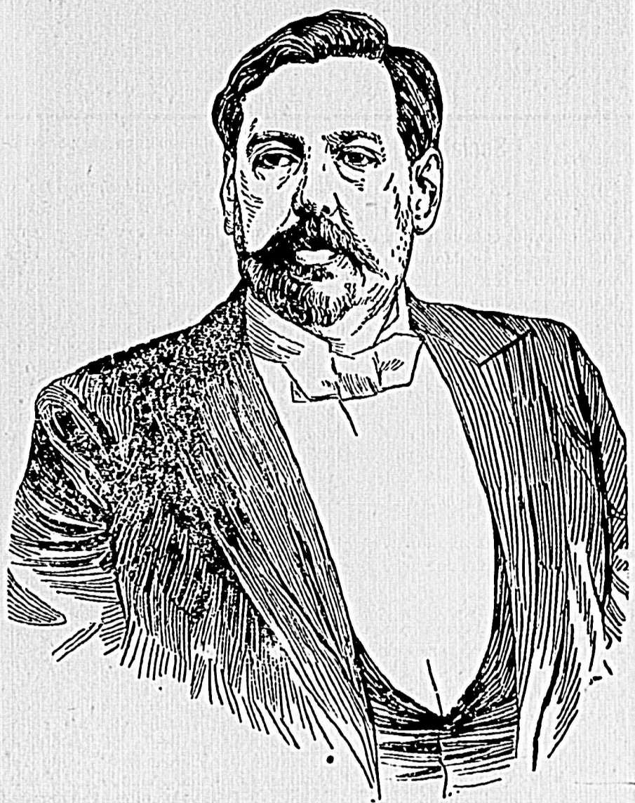
JOSÉ BATLLE Y ORDÓÑEZ

Por un año $ 10.00 Por seis meses 5.50 Por un mes 1.00 Número suelto 0.10 Número atrasado 0.20