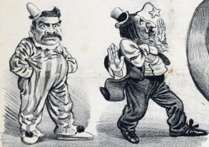
Este hace lo que le mandan y sirve solamente para espietar- se sobre la pista, es su gra- cia. Este distrae la atención pública con reportajes, malas figuras y artículos sobre escritores, para que nadie le concione al maestro libremente.