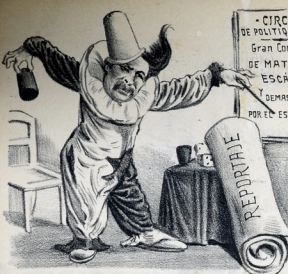
Director de la compañía hábil prestidigitador y reportero.

- CIRCO - DE POLITIQUERIAS Gran Compañia de MATUFIAS, ESCANDALOS Y DEMAS PEQUEÑEZAS POR EL ESTILO.