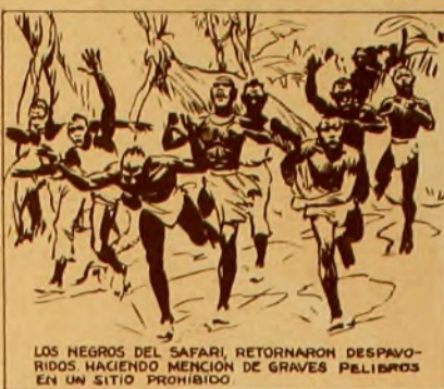
LOS NEGROS DEL SAFARI, RETORNARON DESPARRAMADOS HACIENDO MENCION DE GRAVES PELIGROS EN UN SITIO PROHIBIDO.