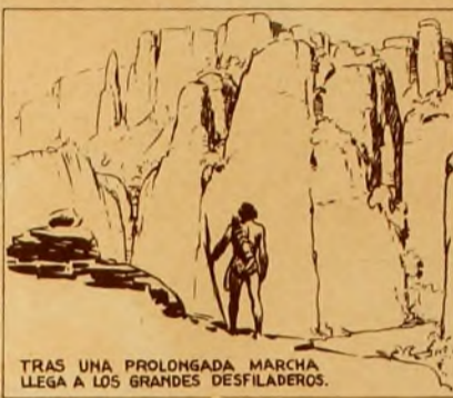
TRAS UNA PROLONGADA MARCHA, LLEGA A LOS GRANDES DESFILADEROS.