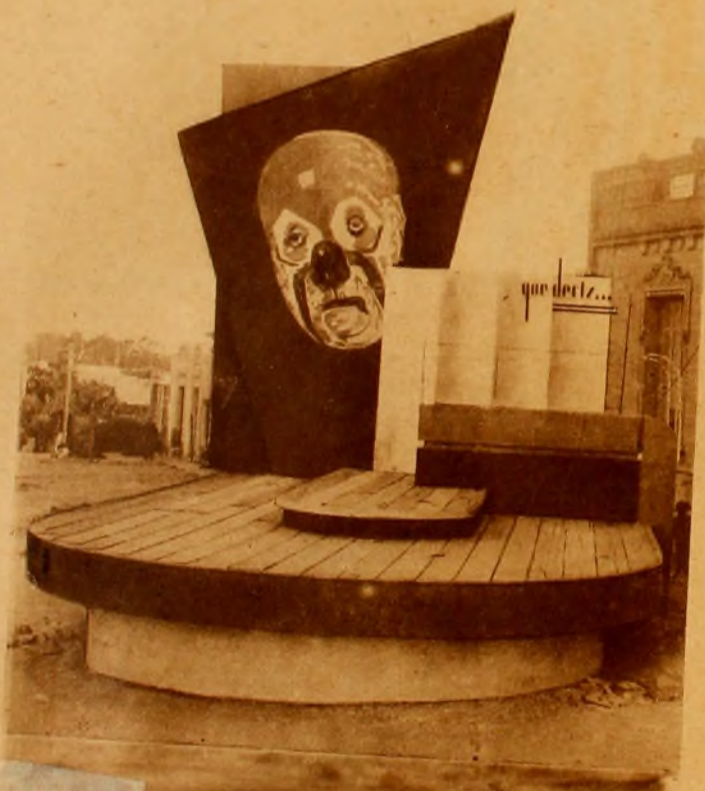
"QUE DECIS..." primer premio general, ubicado en Larrañaga y Rivera