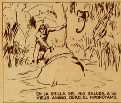
EN LA ORILLA DEL RIO SALUDA A SU VIEJO AMIGO, DURO, EL HIPOPOTAMO.