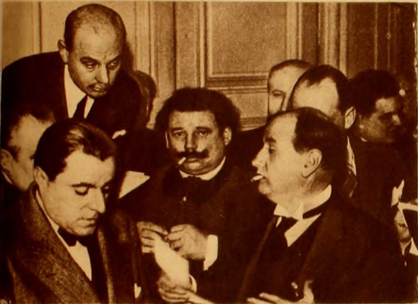
El nuevo primer ministro francés, Daladier, informa a los periodistas y correspondientes la constitución definitiva de su Gabinete