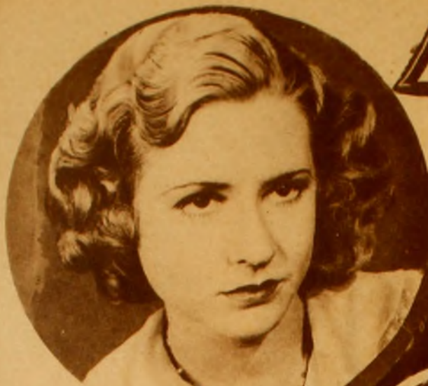
CONSTANCE BENNETT en "El Precio de la Fama" otra de las novedades que se preparan para la temporada cinematográfica