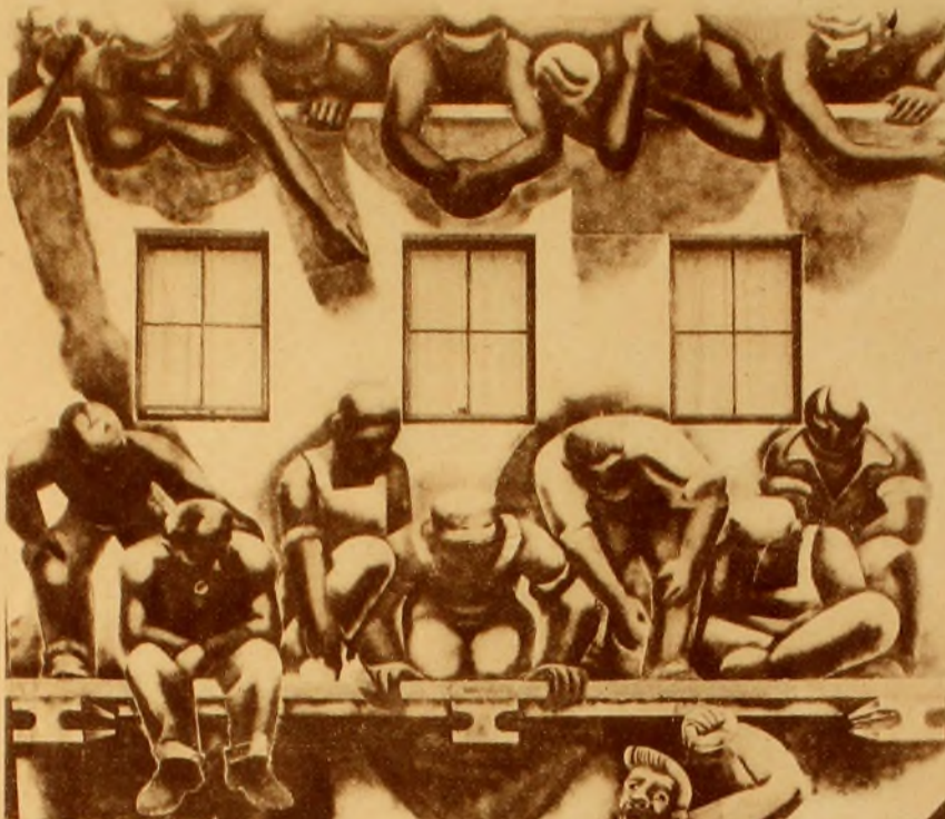
MITIN DE FABRICA

David Alfaro Siqueiros al igual de los artistas clásicos, está pulsando — delicado — esta época vertiginosa y donde el paroxismo maravilloso de la humana — en el invento, en el pro- la superación material — se salpica o se asfixia con las desigualdades. Hemos pues toda divagación teórico-es y hagamos resaltar este "fenómeno" de extraordinaria trascendencia estética, en el mismo plano de la trasce- humana y de la plástica. Para asegu- hay que desterrar del léxico todo ad- y entonces situar su pintura en este como un hecho científico, claro, . Es la manifestación de arte, en vi- en sintonización universal, convergi- actividad y en realidades con todo lo rodea, vive, sufre, construye y suena a dador.