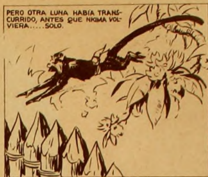
PERO OTRA LUNA HABIA TRANSCURRIDO, ANTES QUE NKIMA VOLVIERA... SOLO.