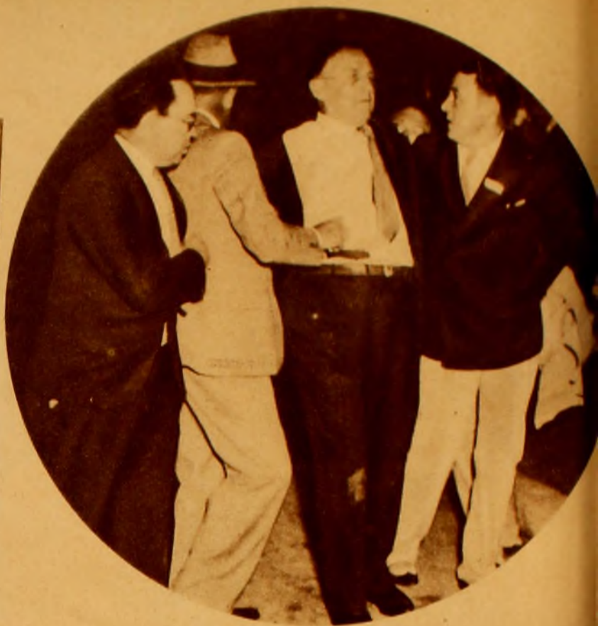
DEL ATENTADO A ROOSEVELT. — Giuseppe Zangara, entre dos representantes de la autoridad en Miami (Florida) detenido luego de descargar cinco tiros en su atentado contra el presidente Roosevelt, que salió ileso, hiriendo a cinco personas, entre ellas el alcalde de Chicago, que aparece en óvalo al ser transportado al hospital. El arma que lleva en la mano el policía es la que sirvió a Zangara para el atentado.