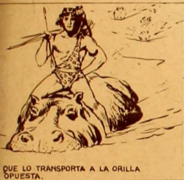
QUE LO TRANSPORTA A LA ORILLA OPUESTA.