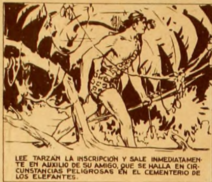
LEE TARZAN LA INSCRIPCION Y SALE INMEDIATAMENTE EN AUXILIO DE SU AMIGO, QUE SE HALLA EN CIRCUNSTANCIAS PELIGROSAS EN EL CEMENTERIO DE LOS ELEFANTES.