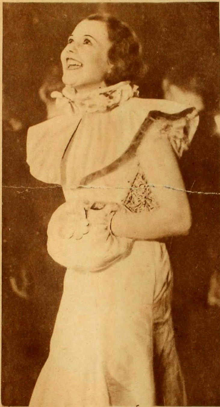
ELEGANTE traje en moiré rosa con cuello formando capa, manchón haciendo juego