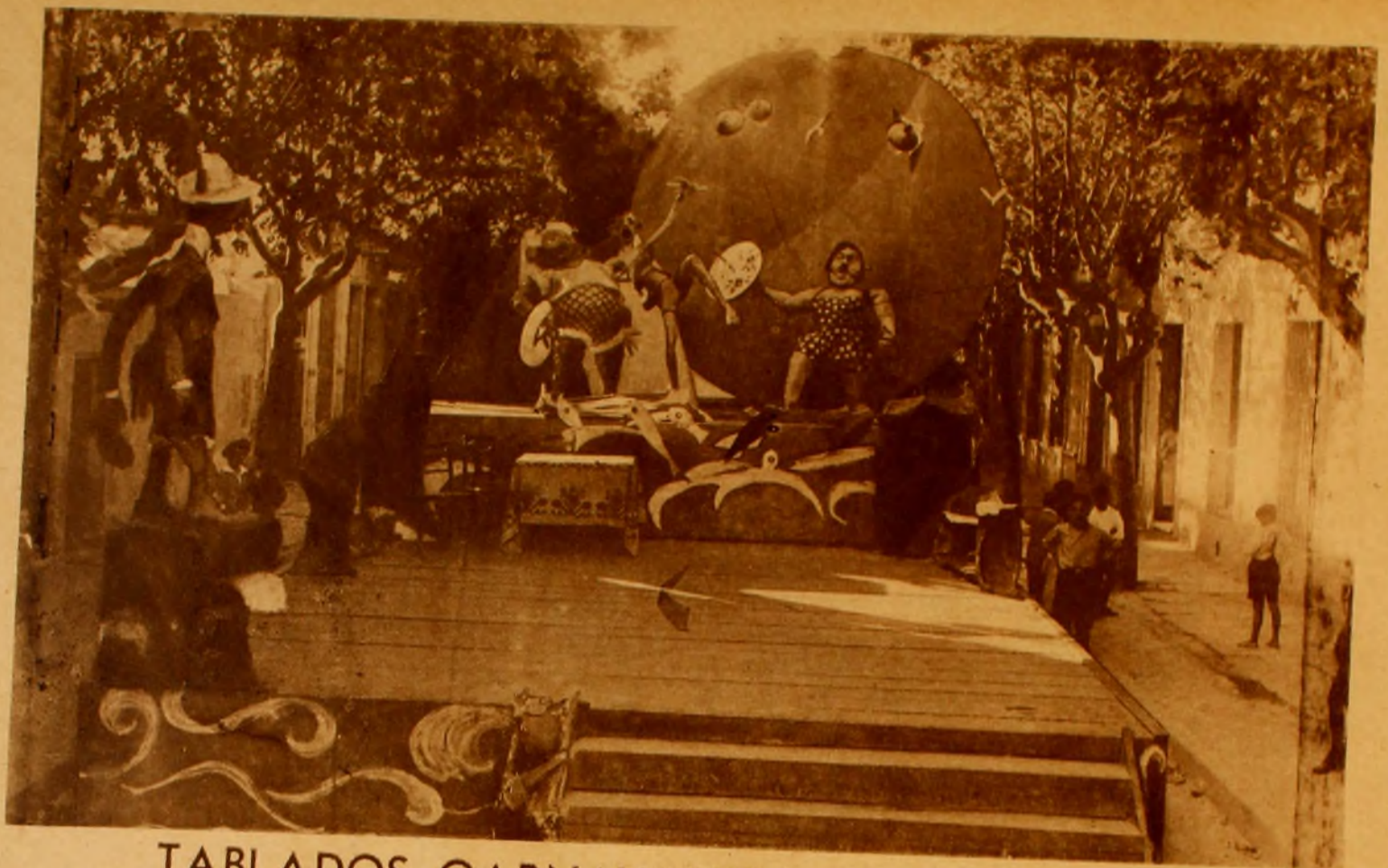
EL PRIMER PREMIO DEL NIÑO levantado en 8 de Octubre y Fortín