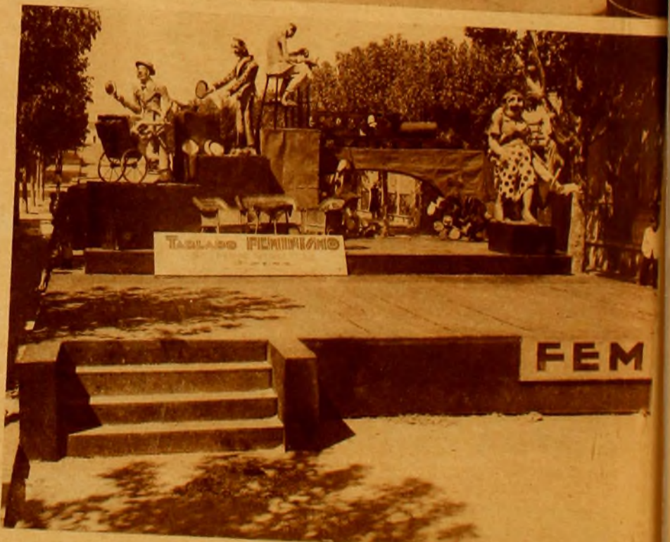
"FEMINISMO" que también obtuvo uno de los primeros premios municipales. Está levantado en Cerro Largo y Juan Paullier