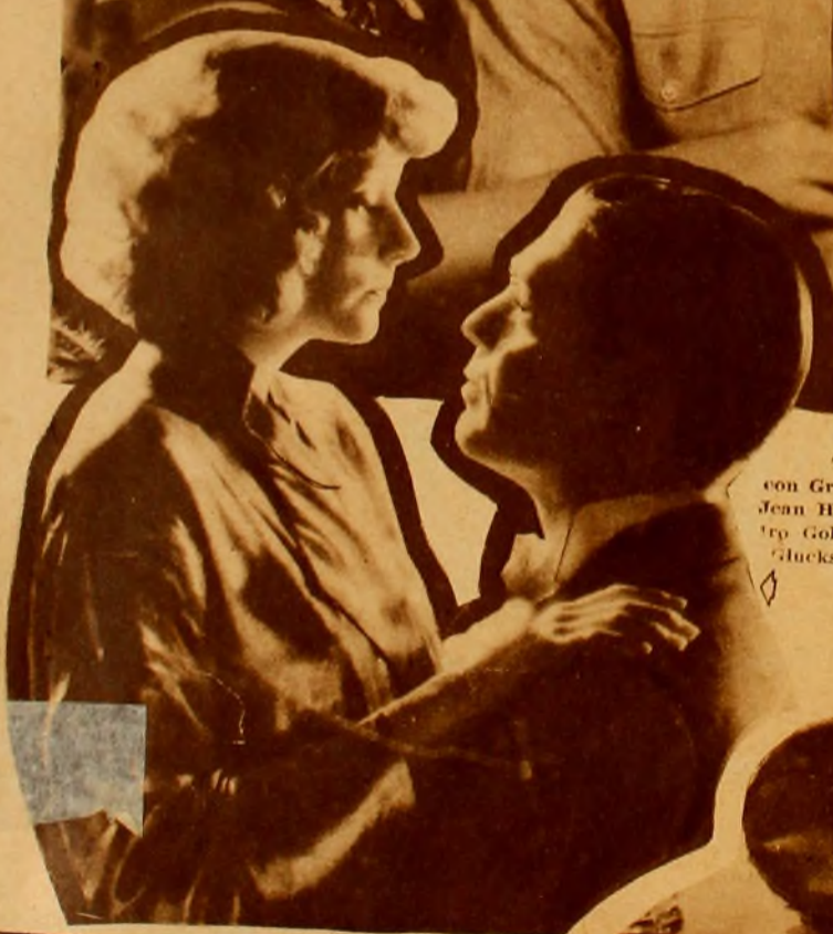
"SUSANA LENOX" con Greta Garbo, Clark Gable y Jean Hersholt, película de la Me- tro Goldwing Mayer, que la casa Glucksmann dará a conocer en breve