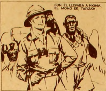
CON EL LLEVABA A NKIMA, EL MONO DE TARZAN.