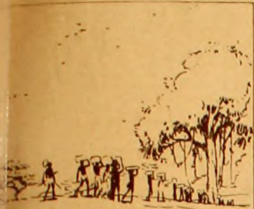
EL JOVEN EXPLORADOR ERICH VON HARBEN, AMIGO DE TARZAN, HABIA PARTIDO PARA OTRA EXPEDICION.