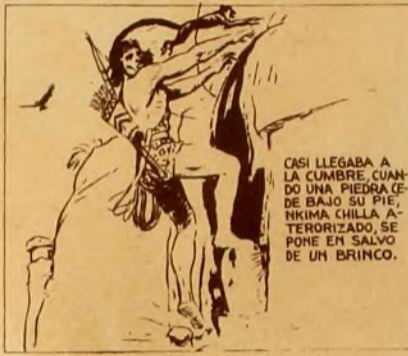
CASI LLEGABA A LA CUMBRE, CUANDO UNA PIEDRA CEDE BAJO SU PIE, NKIMA CHILLA ATERRORIZADO, SE PONE EN SALVO DE UN BRINCO.