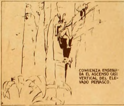
COMIENZA ENSEGUIDA EL ASCENSO CASI VERTICAL DEL ELEVADO PERASCO.