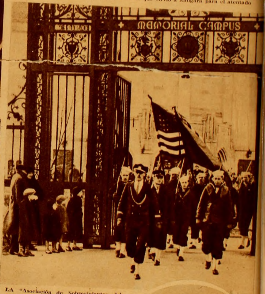
LA "Asociación de Sobrevivientes del Luscania", buque hundido por un submarino alemán en las costas de Irlanda, cuando la guerra, realizó una ceremonia en homenaje a los soldados americanos que perdieron la vida en ese lance.