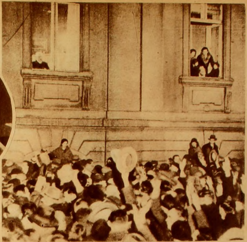
La designación de Hitler para el cargo de Canciller provocó entusiasmo en algunos partidos políticos de Alemania. Las fotografías muestran a la multitud ante los balcones de la residencia de Hindenburg, aclamándolo luego de haber firmado el decreto que llevó al leader facista a la jefatura de Gobierno. La otra nota muestra a los "Nazis" saludando a Hitler que aparece en uno de los balcones del hotel Kaiserhof, en Berlín