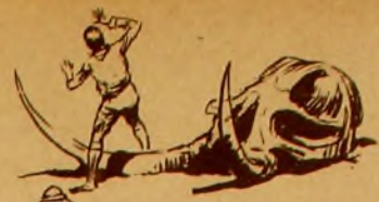
EL SITIO PROHIBIDO