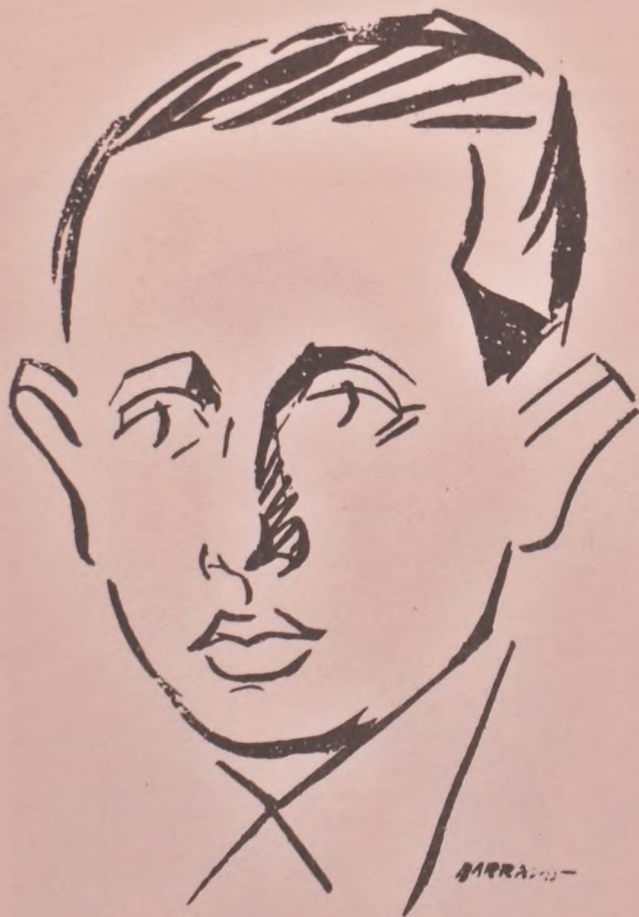
GUILLERMO DE TORRE POR BARRADAS