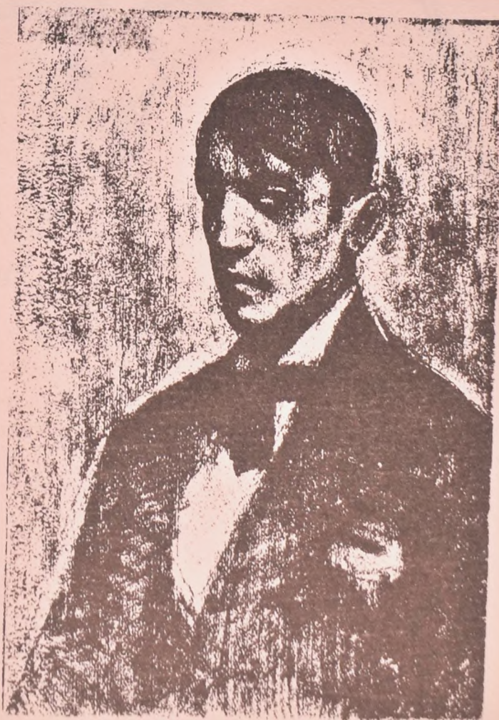
PICASSO, POR GUSTAVO DE MAEZTU.

Durante largo tiempo, sentados en las modestas sillas del taller, al lado de la revuelta mesa de trabajo, en aquel ambiente donde surgen a la vida algunas de las obras más significativas del arte contemporáneo, estuvimos cambiando y completando nuestros recuerdos de la áurea existencia estudiantil. Nos quitábamos la palabra uno a otro. ¿Se acuerda usted