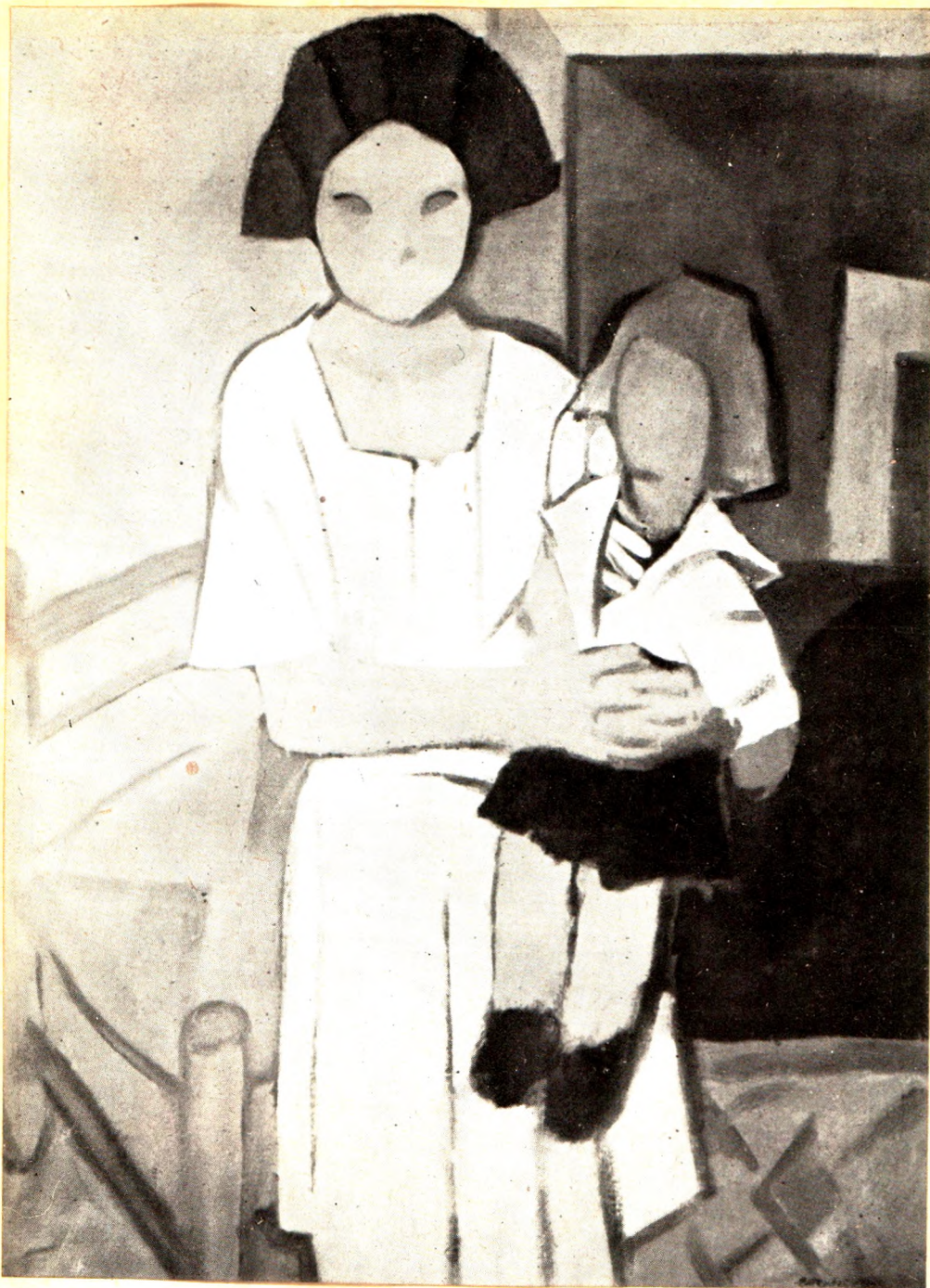
RETRATO DE NIÑA