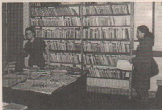
Dos instancias de la Biblioteca Luce Fabbri: