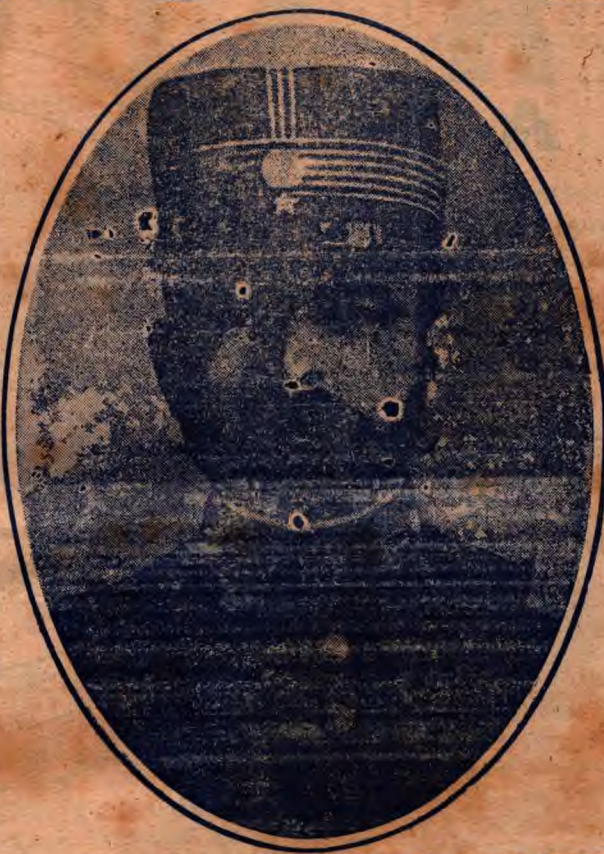
DIEGO LAMAS - 1899