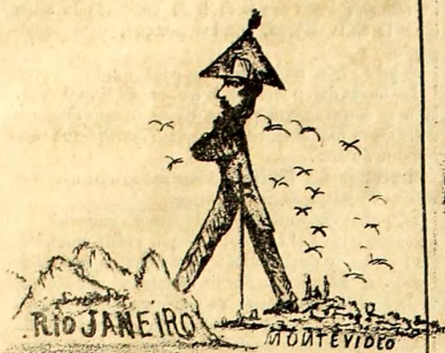
MISION DEL D o TUPIDO.