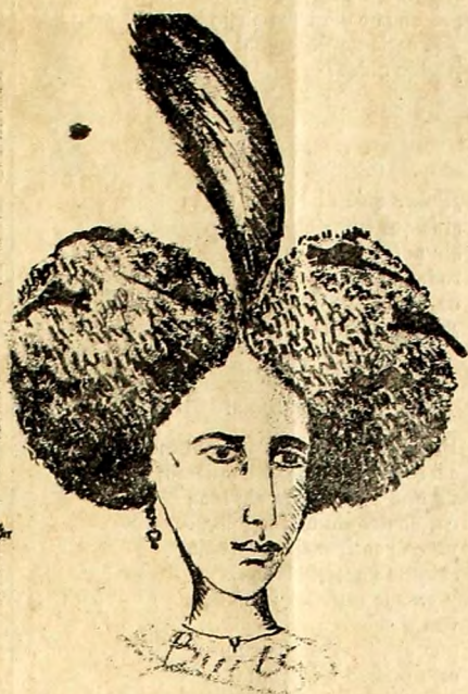
PEINADO Á LA CHIENNE.