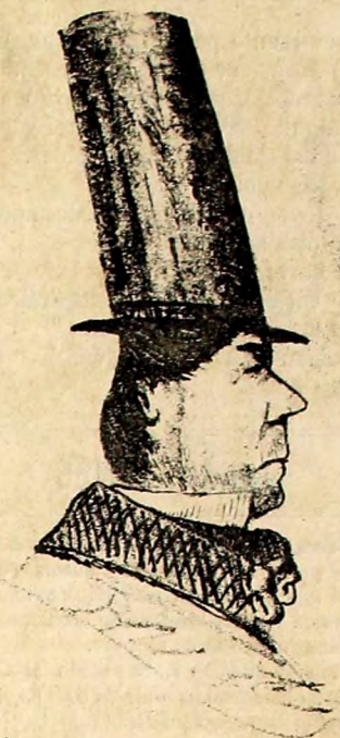
EL DIRECTOR DE LA CLAUQUE.