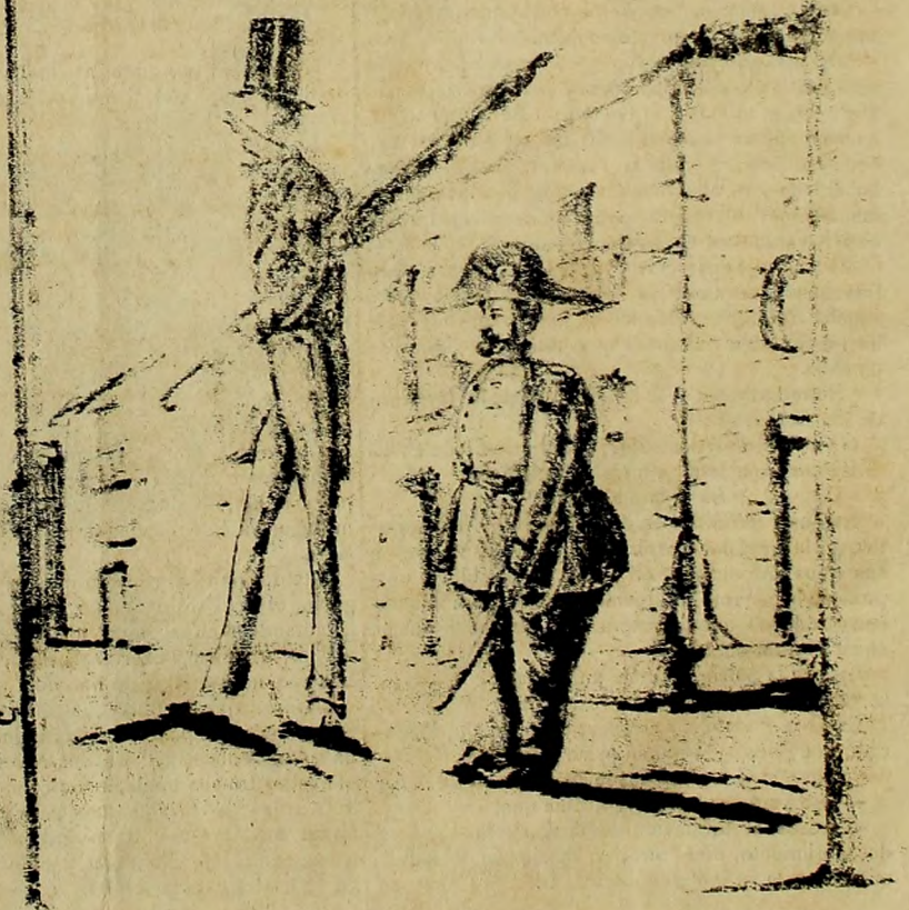
D. Plácido y su edecan se dirigen al banquete batueco.