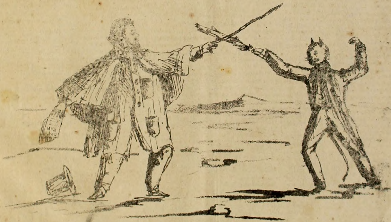
Sarrotaroz tonté tico