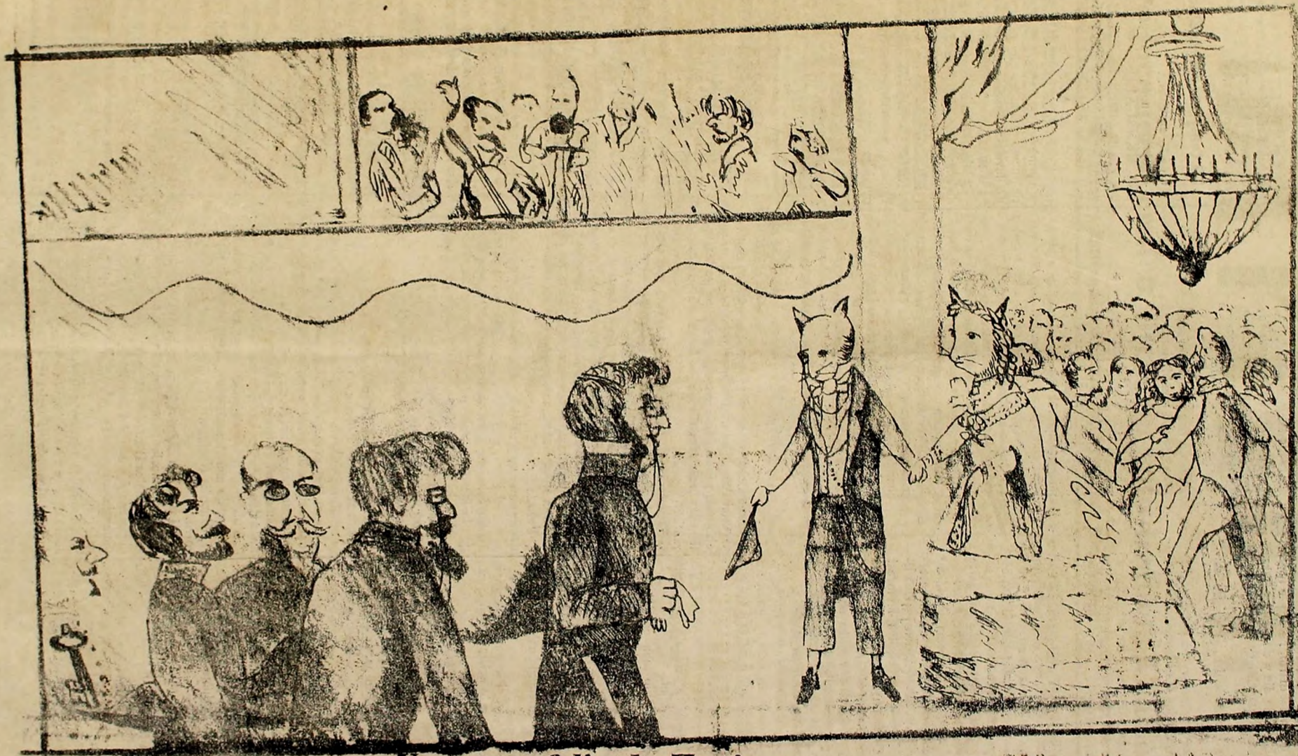
Un sueño feliz de Zapiron.