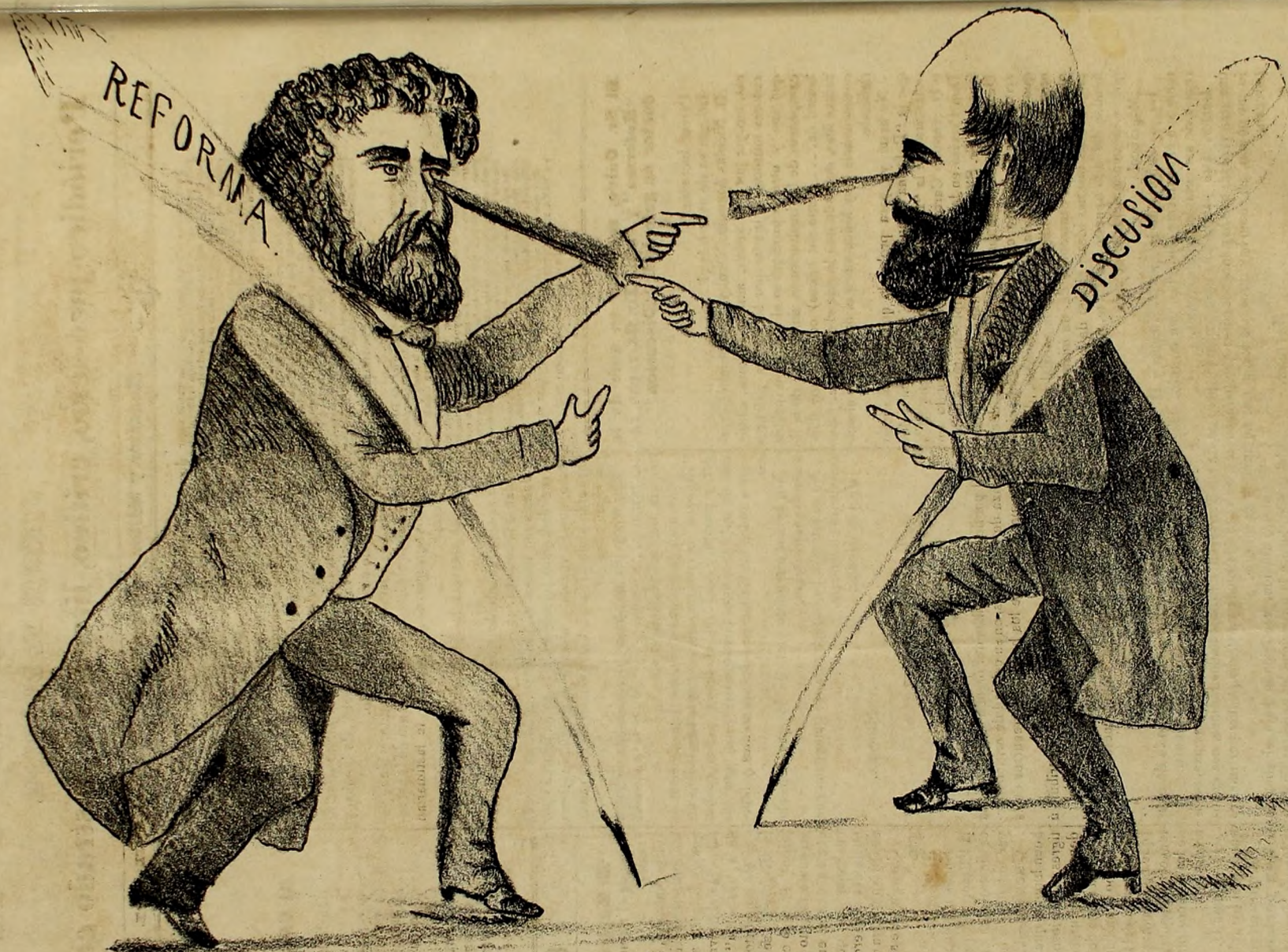
UN JURI DE IMPRENTA.