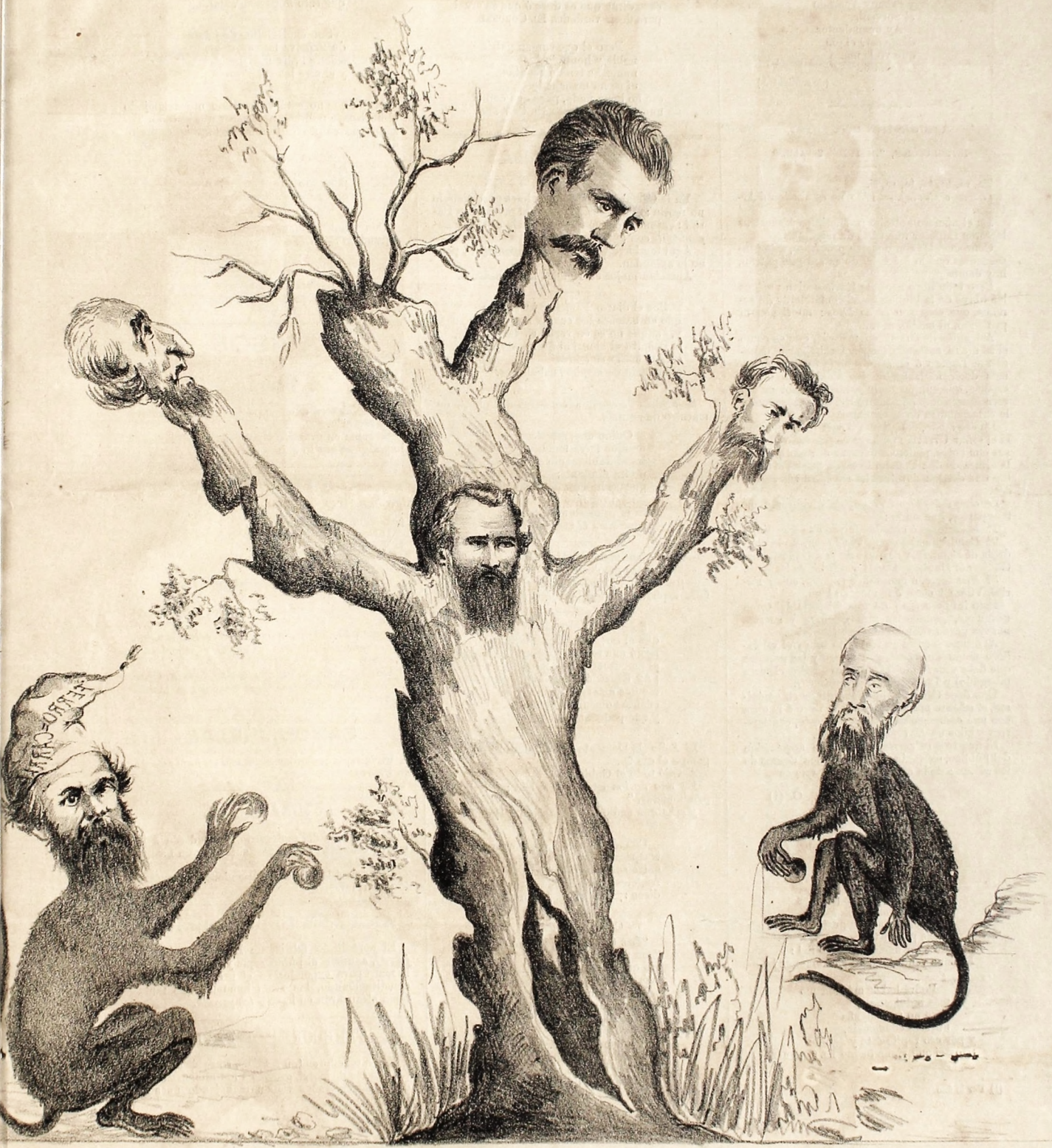
— MACHACO VIEJO NO SUBE A PALO PODRIDO —