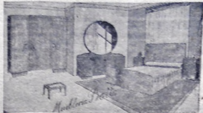
Regio dormitorio en abedul macizo