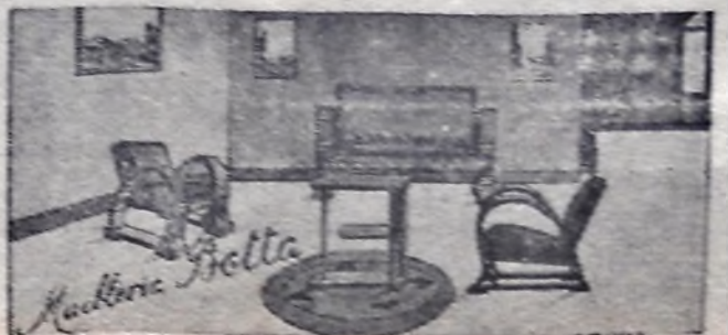
Modelo Living Room tapizado en pelus o tapestri

Para reparaciones de radio contamos con un personal de técnicos