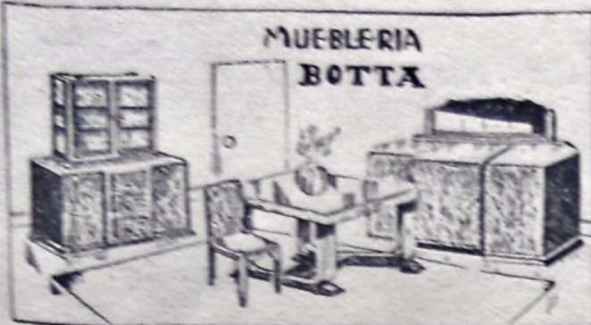
Elegante comedor lustrado en distintos tonos