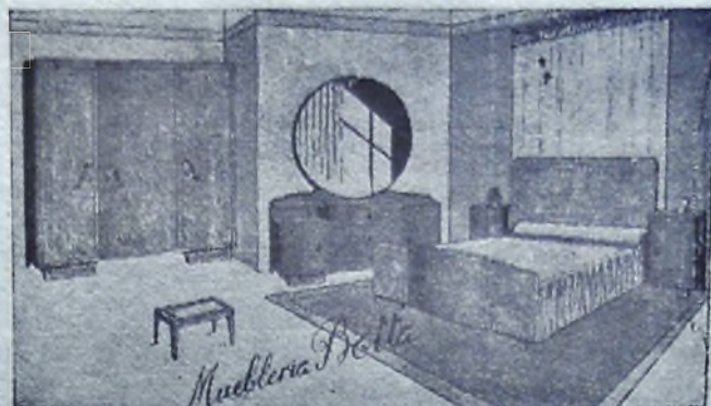
Regio dormitorio en abedul macizo