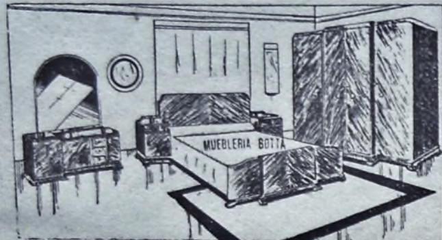
Sorberbio dormitorio en abedul macizo, creación de nuestros talleres

Para reparaciones de radio contamos con un personal de técnicos competentes