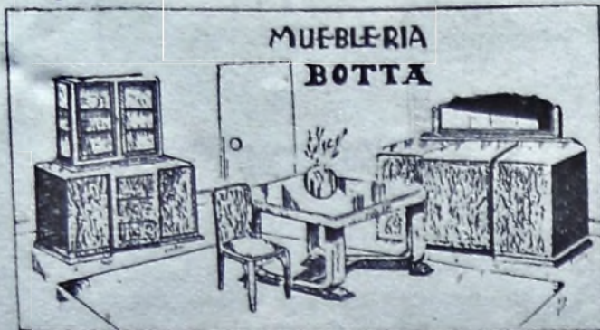
Elegante comedor lustralo en distintos tonos