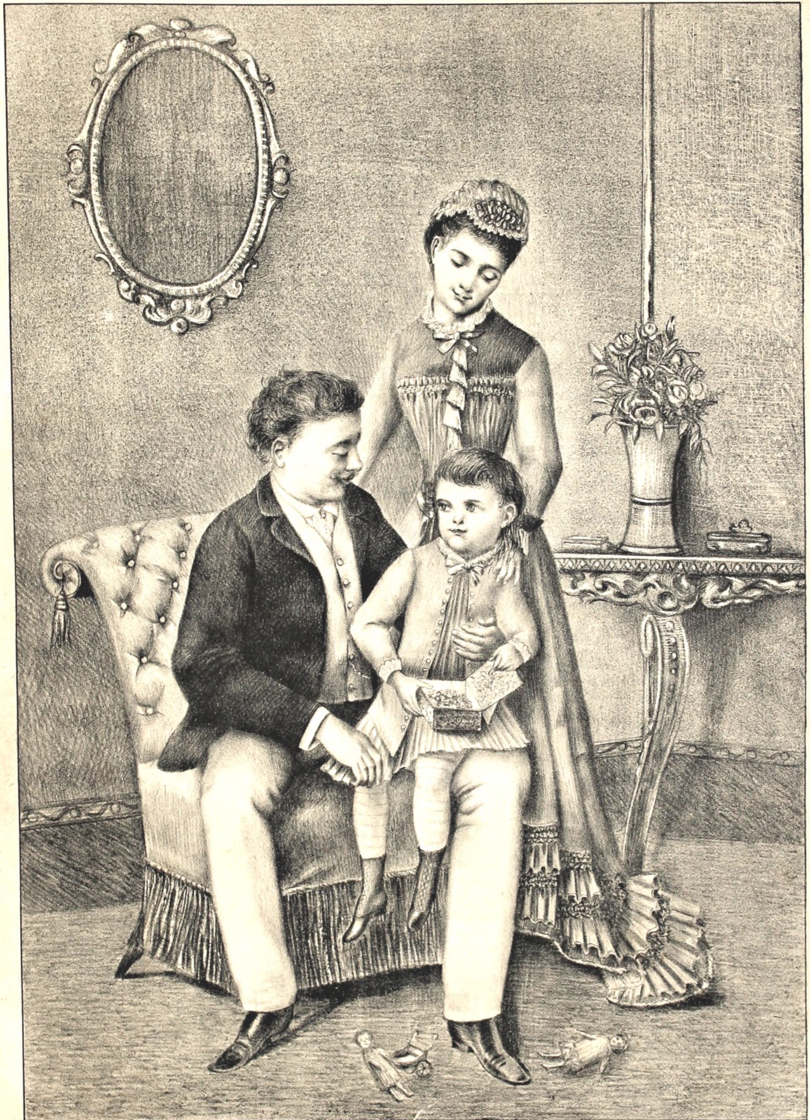
AGUINALDO DE AÑO NUEVO.