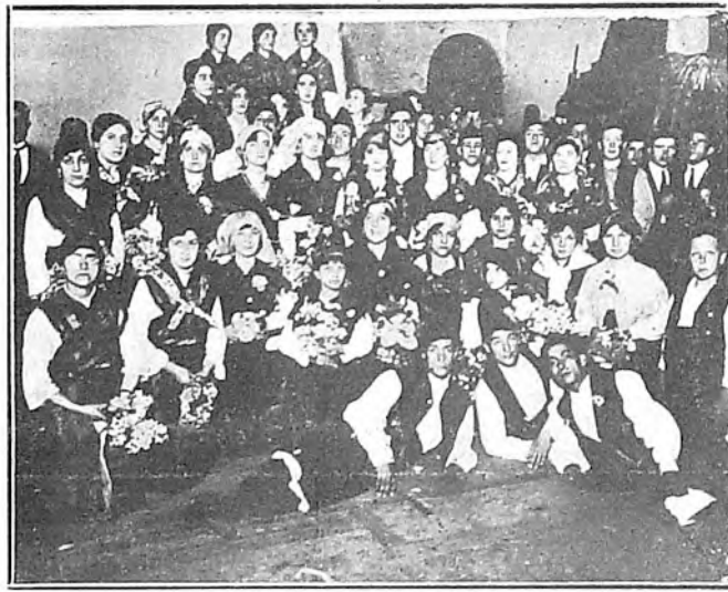
Coro de Mozas y Mozos que tomaron parte en el festival gallego del Teatro Solís

El Coro de Mozas formado por treinta y dos señoritas uruguayas y