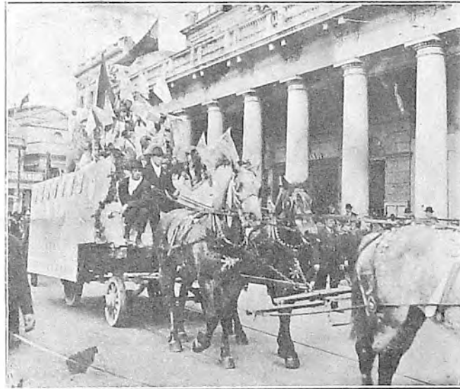
La carroza alegórica del Centro Confraternidad Hispano Uruguaya

españolas que oficialmente asisten a un acto donde está presente el Jefe de un Estado, y más si ese acto es español y se celebra en un día glorioso para España.