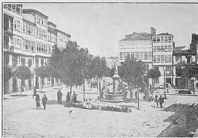
CORUÑA. — Plaza de Santa Catalina

El hacer luz y luz clarísima en problema tan trascendental, es cuestión de decoro para España, para Galicia, y aun más que para Galicia, para Pontevedra, población donde tuvo origen la actual contienda, y en la que se custodian los curiosos documentos que se declaran retocados. En mi sentir que someto con gusto a la consideración de usted, generoso patrocinador de las teorías del señor de La Riega, y a la de cuantos conculgan en su escueta peregrina, debiera trabajarse con entusiasmo ahincó y bajo el amparo y dirección de la Diputación provincial y del Ayuntamiento de Pontevedra, hasta lograr que el Gobierno de Su Majestad en representación de España entera, de