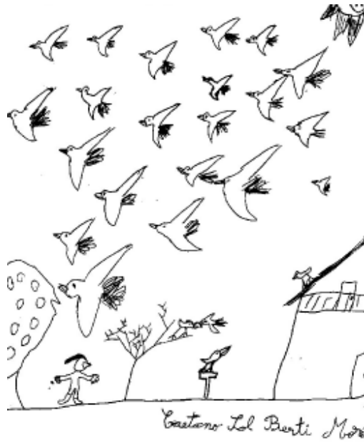
Ilustración de Caetano Sol Berti Moré (7 años)

A todos ellos, sin excepciones, y con el compromiso de apoyar y compartir caminos con una meta común, transmitimos el saludo del equipo de trabajo de el mirador .