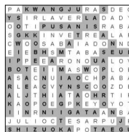
Solución del caldo anterior, allá por junio...