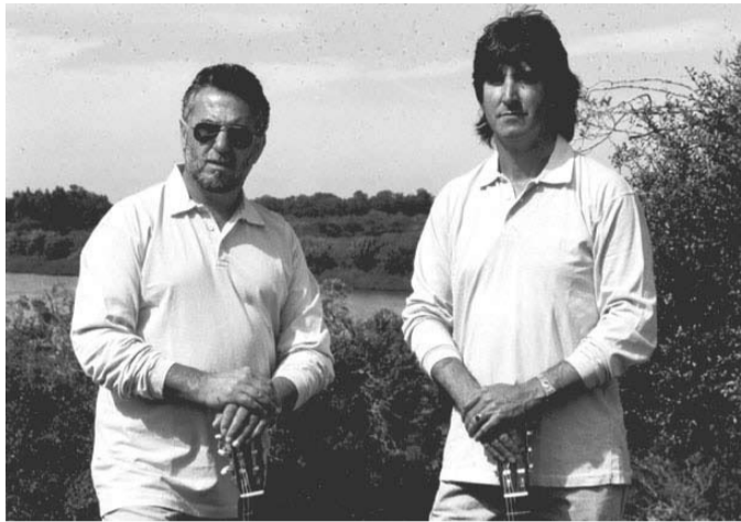
LOS ORILLEROS EN BUENOS AIRES