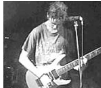
LOS PASTOS EN LAS LOMAS

Ing. Zaprunder zaprunder@adinet.com.uy Redacción: Michigan