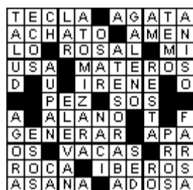
Solución del Crucidrama anterior (¡hace un año!!)