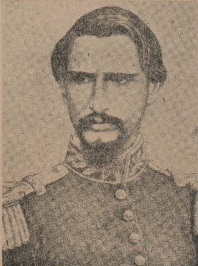
Cubrió de gloria las armas orientales

formó una alianza, cuyo resultado fué la caída de la tiranía de Rosas.