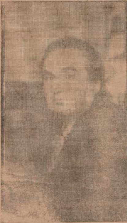
El Intendente y la Habitación.