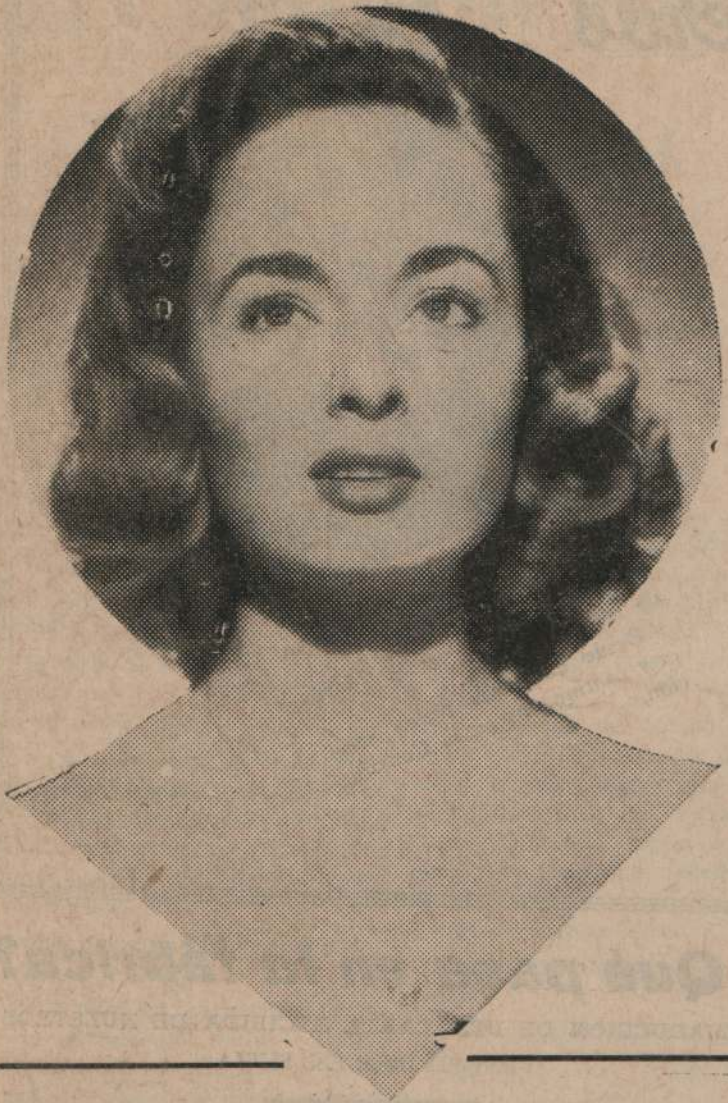
AAN BLYTH, hermosa estrella norteamericana que ha protagonizado el film "Todos los hermanos eran valientes"