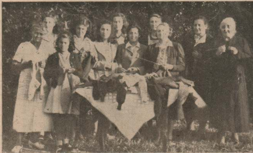
Integrantes de la Comisión Femenina del Comité de Ayuda "Resorgimento", del Barrio Buceo, que forman la brigada femenina de activistas tejedoras, habiendo realizado a la fecha una intensa labor. Su ejemplo, sin duda alguna, digno de ser imitado, encontrará seguro eco en el seno de la colonia italiana y en particular entre el sector femenino.