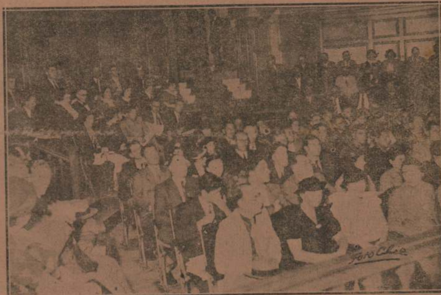
Vista parcial del público que asistió a la conferencia en la Universidad

Expresamos en nombre del "Comité Contra el Antisemitismo" nuestro agradecimiento al señor Rector Dr. Carlos Vaz Ferreira y a las autoridades universitarias por habernos concedido la alta tribuna de la Universidad para llevar a cabo la mencionada conferencia.