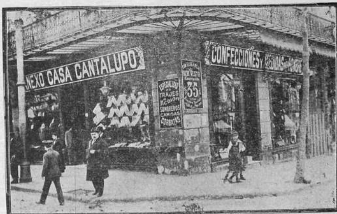
Anexo Casa Cantalupo: Uruguay y General Rondeau