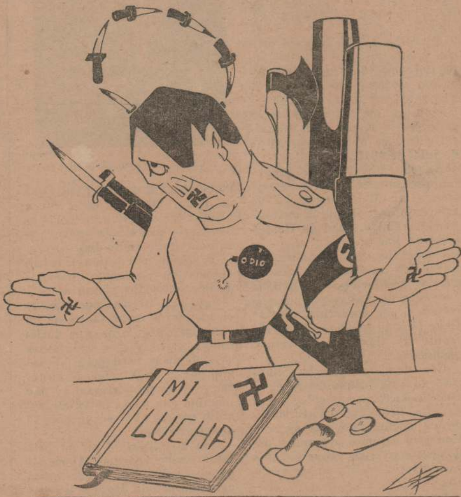
Nuestro dibujante sugiere este proyecto de altar para el culto del nuevo dios de la mitología nazi