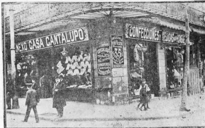
Anexo Casa Cantalupo: Uruguay y General Rondeau