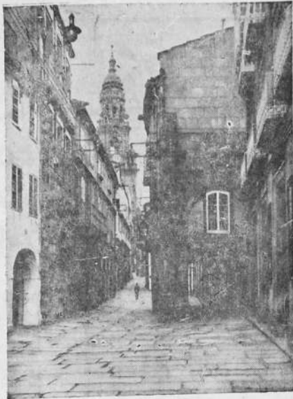
La Rua, de Villar, de clásico ambiente norteño, evocadora de cien legendarias leyendas gallegas.