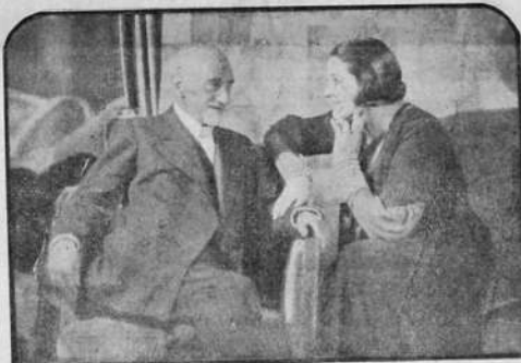
La primera gran jornada escénica de la temporada en España, ha sido el estreno de "La melodía del jazz-band", nueva y admirable comedia de don Jacinto Benavente...