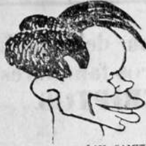
EL MAGO DEL BALON, SAMITIER

COLOCACION DE LOS DISTINTOS CLUBS QUE PARTICIPAN EN EL CAMPEONATO OFICIAL DE TERCERA EXTRA SERIE C