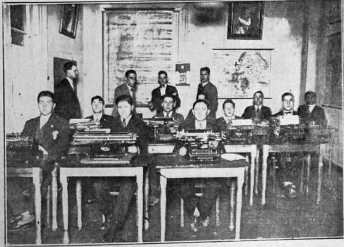
NUESTRO COLEGIO. — Clase de Dactilografía

¡Ama usted a "Casa de Galicia", pues concurre a sus asambleas, no es tolerable esa indiferencia suya, nuestra Institución necesita el apoyo de todos para el gestamiento de su progreso.