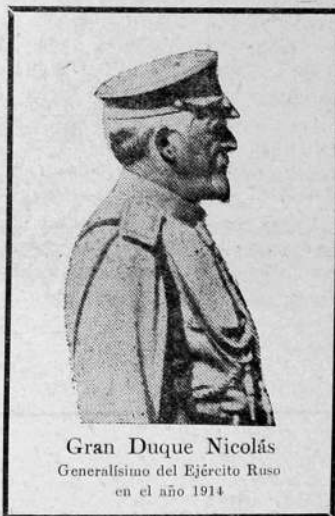
Gran Duque Nicolás Generalissimo del Ejército Ruso en el año 1914