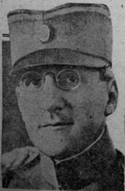
ALEJANDRO I Rey de Yugoslavia

Въ «Народныхъ Листахъ» появи лась статья дра К. П. Крамаржа въ связи съ извѣстиями о томъ, что Югославия рѣшила не признавать Сов. Власть. Приводимъ эту статью полностью.