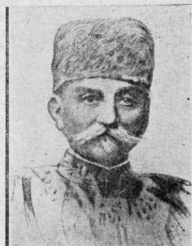
PEDRO I Rey de los Servios

Мы увѣрены, что тысячи и тысячи добрыхъ славянскихъ сердецъ съ глубокой благодарностью пожела ютъ Королю Александру, чтобы Го сподъ далъ ему силы и здорвье и чтобы онъ, во главѣ своего народа, во главѣ братской намъ Югославii могъ занять почетное мѣсто среди