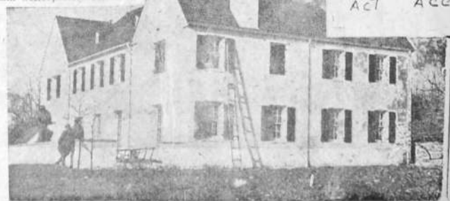
Домъ, гдѣ произошло похищеніе