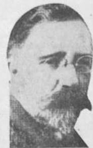
КАМЕНЕВЪ — выслан в Сибирь, по обвинению в соучастии в убийстве Кирова.