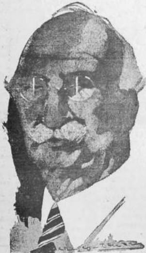
ЛЕРУ — Председатель Совета министров Испанского коалиционного Правительства, которому угрожает кризис.