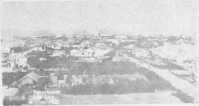
PUNTA DEL ESTE