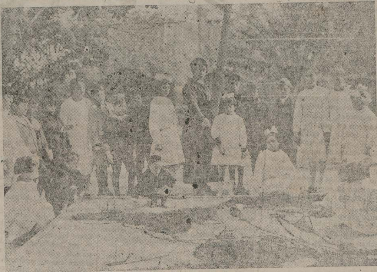
Una lección de geografía. Viajes imaginarios. Rutas en el Atlántico

vehemencia aún) un anhelo infinito de vivir entre aquellas sombras de la ignorancia atávica, par contribuya a destruirlas, para enseñar a pensar, para enseñar a expresar, para encausar el sentir de aquellas pobres gentes que siendo tan buenas hacen tantos males. — de los que somos responsables nosotros que los de-