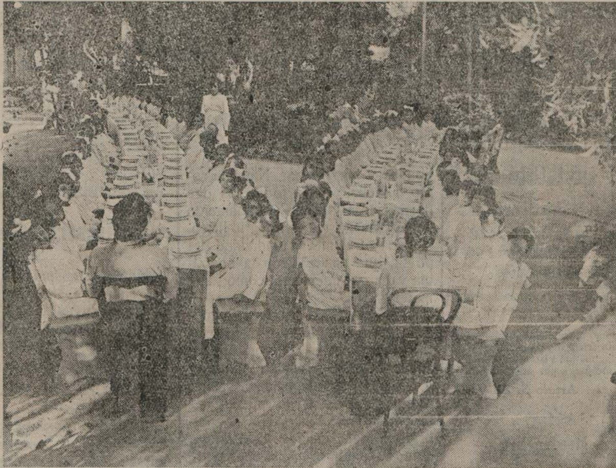
Almuerzo en forma de pic-nic, a la sombra de los árboles

haciendo, ni dejando hacer a sus compañeras, los trabajos.