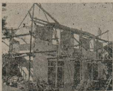
Nuevo pabellón en construcción

Sin molestar con mi profana planta, me deslicé en el bosque de cariño y descanso. De pronto, y cuando más embecido estaba, olvidado de todos y de todo, me despertó el alegre tintinear de una campanilla; a su cristalino sonido los diminutos geniecillos durmientes, se sientan en posición de ángulo recto, sueñan una palmada dada por un genio para mí invisible, y cada geniecillo se pone de pie; una segunda señal y girando sobre sus talones, como hábiles soldaditos doblan rápidamente sus lechos del bosque, que y marchan ordenados hasta un pabellón cercano, donde los dejan.