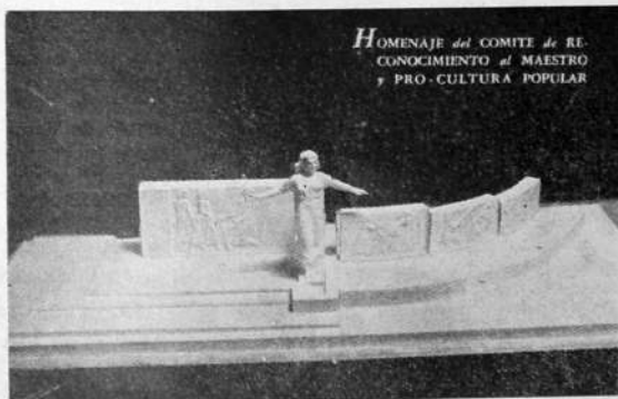
HOMENAJE del COMITE de RE- CONOCIMIENTO al MAESTRO y PRO-CULTURA POPULAR

«Maquettes del Monumento al Maestro, que se emplazará en Montevideo y del que recientemente se colocó la piedra fundamental, como podrá verse en la nota que en otra página insertamos.»