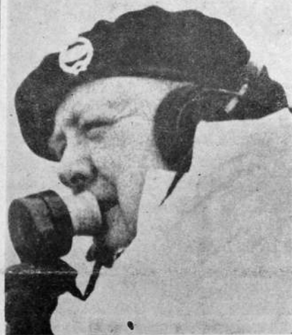
PALADIN de la LIBERTAD del MUNDO