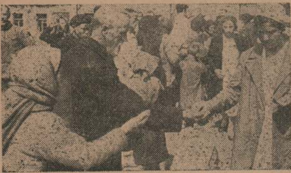
Los ancianos en la Rusia Soviética piden limosna. Esta escena fué captada en un mercado de Sabostopol y puede advertirse el gesto de imploración de las figuras de primer plano.

Crear que el régimen bolchevique libera a las masas.