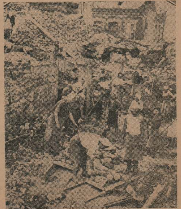
Las mujeres en Rusia trabajan en las faenas más rudas. Aquí vemos a varias cuadrillas de obreras trabajar en el transporte de escombros.

Algunos miembros de la embajada quieren ver en esto el fracaso del régimen. Yo sostuve con otros que posiblemente esa miseria fuese fruto de la última guerra pero me pidieron que explicara el porqué de los lujosos tapados de pieles y los taxis junto a los pies descalzos y la mendicidad. Los defensores nos vimos en figurillas para defender nuestra tesis. Una cosa era evidente en Odessa y saltaba a la vista. Allí había hambre y desigualdades irritantes como en cualquier país capitalista. La suciedad de la gente es superior a cuanto he visto antes.