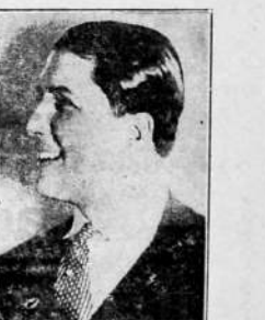
GARDEL, el mago de la canción criolla