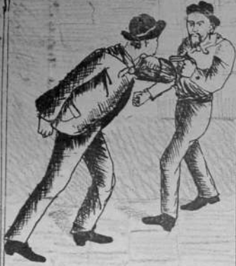
HERIDO DE UN BALAZO EN UN BRAZO