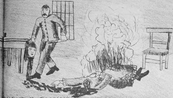
ORRIBLE PARRICIDIO - UN PADRE ANTROPOFAGO