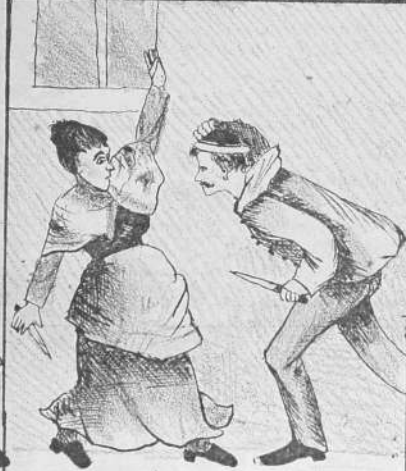
El delito de una madre