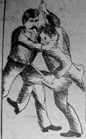
PELEA Y PUNALADA EN LA CALLE PIEDAD N.º 35