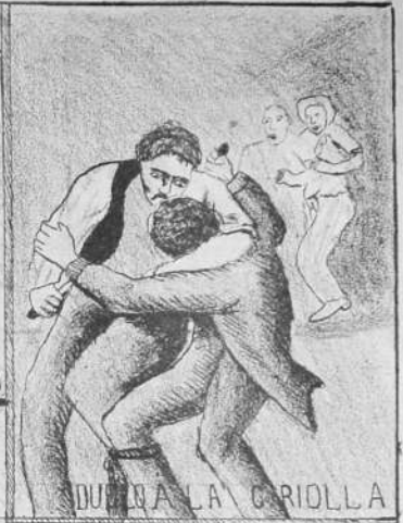
DURO A LA CARIOLLA