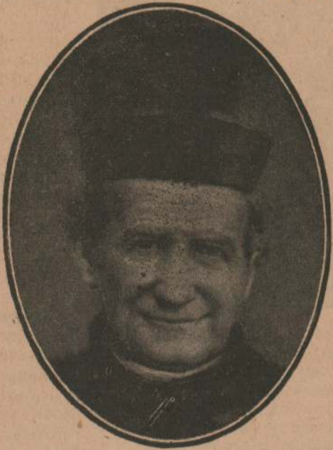
San Juan Bosco, el Santo del Siglo

EN el presente, los niños, ciudadanos del mañana, educan el sentimiento en el hogar y en la escuela, yunques que modelan su futura personalidad. En ellos, deben aprovecharse las distintas oportunidades que se presentan para descubrir y estimular toda noble inclinación, todo el sentimiento generoso entre el que cabe destacar el culto a San Juan Bosco, a la Patria, a los Padres, a los Maestros, al Bien, al Estudio, al Trabajo y a la Amistad. De las escuelas salesianas deben salir normas para el bien de Dios, de la Patria y de la Familia, generaciones cada vez mejores en lo moral y en lo físico unidas por lazos de cordial amistad que se intensifiquen a través de los años, formando así esos vínculos que dan el verdadero carácter nacional a los pueblos. Ello es lo que secundaremos en la medida de nuestros esfuerzos con este periódico, CUYAS