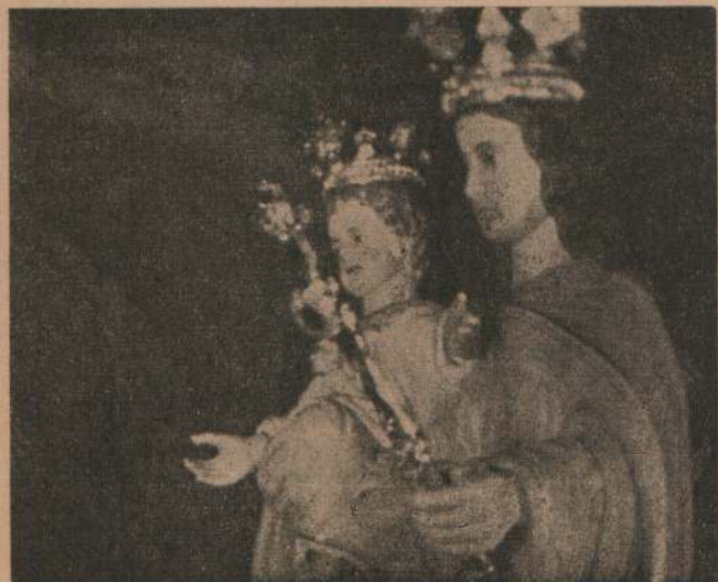
LA Imagen coronada al salir del templo para ser llevada por las calles del Cordón.

Como expresión material de gratitud y de amor a Dios y a la taumaturga Virgen de Don Bosco, todos sus devotos se han desprendido de joyas y recuerdos preciosísimos y con ellos se han fabricado las dos regias coronas de oro, un cáliz y un copón valiosísimos. La devoción a la Santísima Eucaristía y a la Auxiliadora ha sido y será siempre el secreto regenerador de la Obra de Don Bosco y de sus hijos los Salesianos.