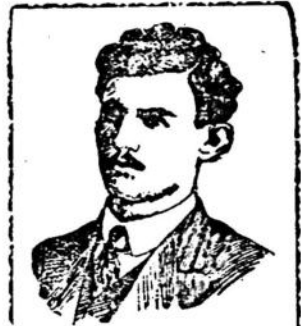
Don MALVINO C. O. LEITE Arrestal de Sao Paulo - Escola de Es - CRAZIL Coraje de mestizaje sfilizica con el Ejército de Armas del Brasil y go- bico Judo da Silva Silveira Se vende en todas las farmacias y droguerías

"Hudson Super Six" La marca de calidad EL AUTO Impuesto por sus méritos