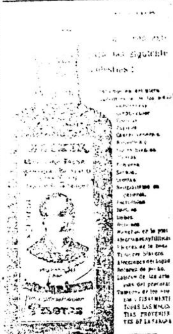
JUAN DEPURATIVO DE LA SANGRE