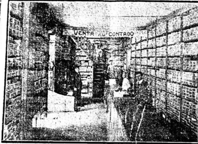
SECCION ZAPATERIA DE LA CASA BRITOS