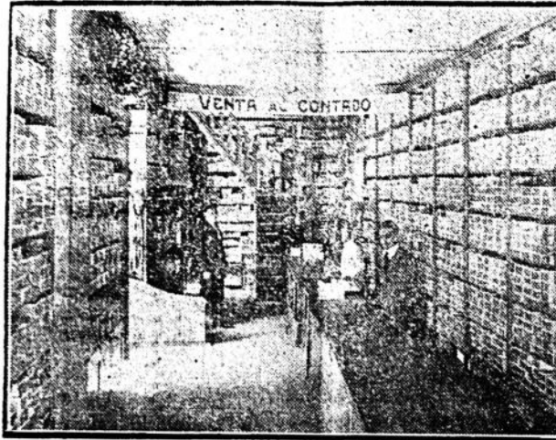
SECCION ZAPATERIA DE LA CASA BRITOS

MAMELUCOS PARA NIÑOS DE 2 A 4 AÑOS DESDE $ 1.20