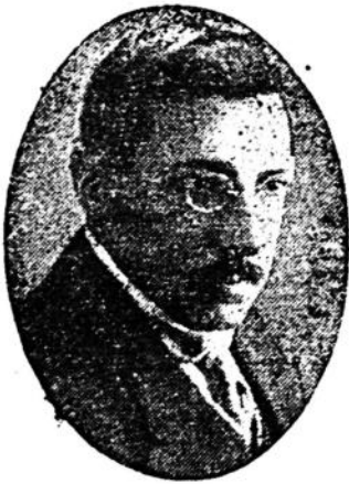
Candidato del Partido Colorado a la Presidencia del Consejo Nacional de Administración