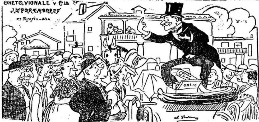
Son INOCENTES, completamente INOCENTES Los que desconocen los saludables efectos de la incomparable yerba ONETO

ONETO, VIGNALE y CIA IMPORTADORES 25 Agosto - 1934.