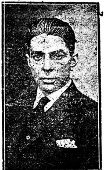
Candidato del Batllismo departamental a la Representación Nacional

Mañana estará de pié el Partido Colorado dispuesto a vencer a los blancos