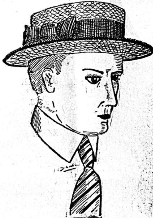
TIPO DE GRAN MODA, EL PREFERIDO DE TODOS CONOTIER