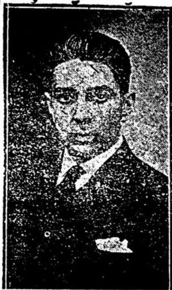
Reelecto Diputado por el Batllismo de Florida