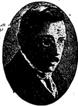
Eminente estadista que ayer fué electo Presidente del Consejo Nacional de Administración