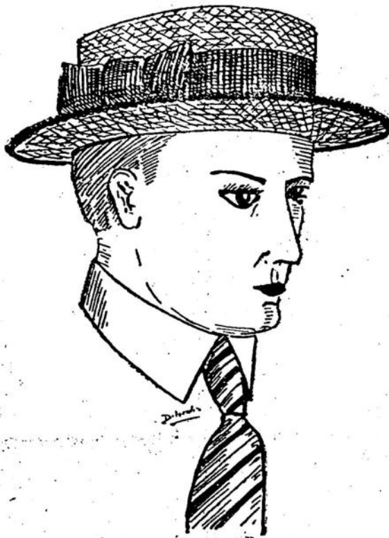
TIPO DE GRAN MODA, EL PREFERIDO DE TODOS CONOTIER