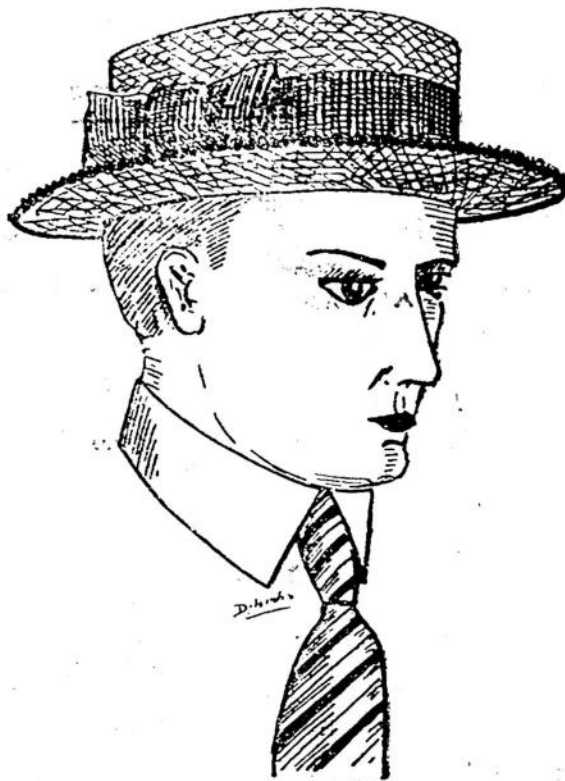
CONOTIER TIPO DE GRAN MODA, EL PREFERIDO DE TODOS