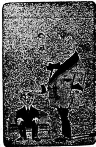
El decano de los médicos foridenses