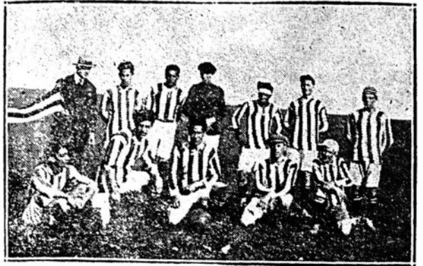
Primer team del «Sarandí F. C.» que ocupó a uno de los primeros puestos en el campeonato Departamental