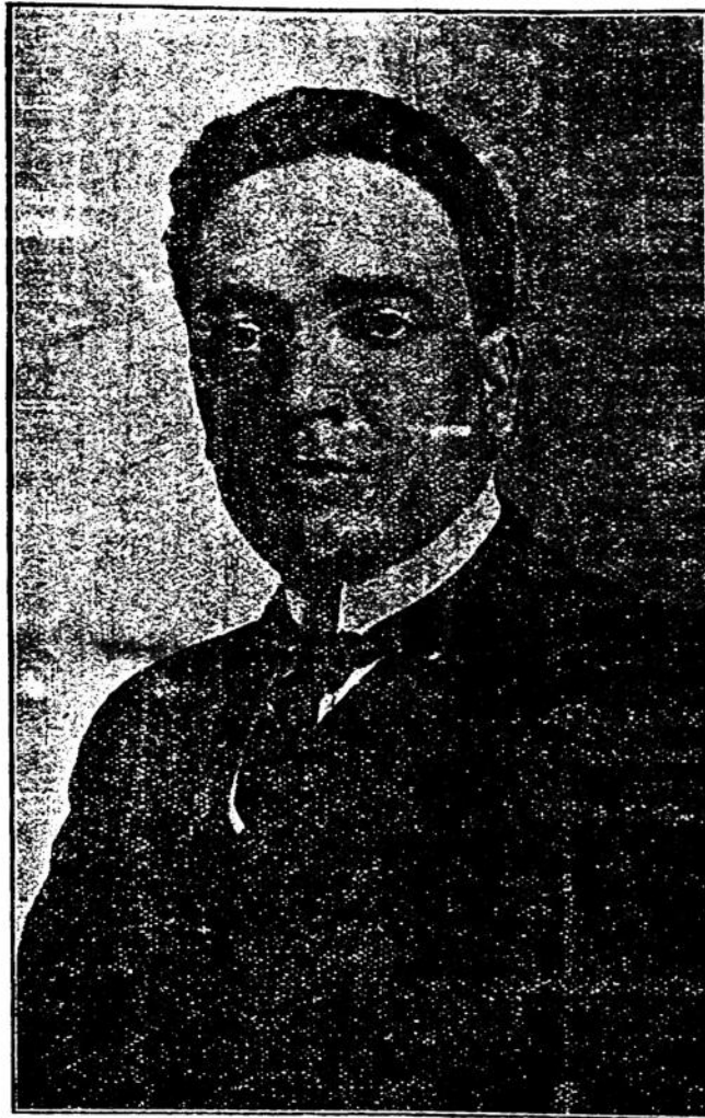
DOCTOR BALTASAR BRUN

Para el revolucionarismo cálido y constante de Máximo Gorky, la consagración del premio Nobel sería, en cierto modo, el reconocimiento de su fruto en su patria. Para Unamuno y Cro-